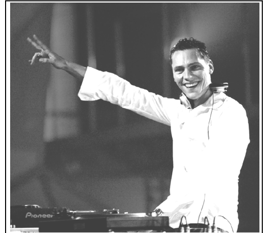
El pinchadiscos DJ Tiesto

Yo selecciono y mezclo música para el público en discotecas, bares y fiestas. Mi especialidad es el hip hop que tiene raíces afroamericanas. También me gusta reggae , hardcore y chillout . Cuando era más joven, yo era bailarina de breakdance y eso era buena preparación para la profesión de pinchadiscos. Breakdance es una danza urbana que forma parte de la cultura hip hop.